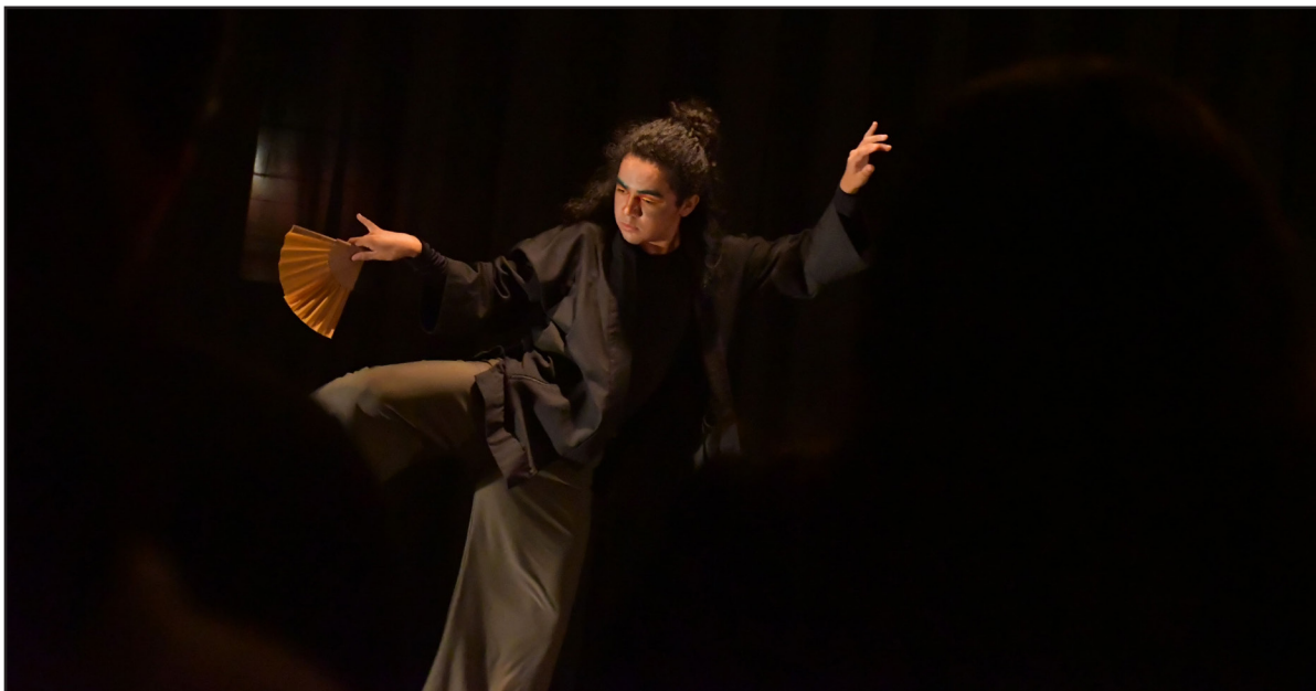
Imagen 3. Personaje en movimiento. Foro de Corpo-Espacio Danza, Xalapa, Veracruz, México. 2022.

de las clases de la Facultad de Danza. Sin embargo, el manejo de la técnica del maestro Oceransky y la síntesis que comparte a su vez la maestra Hernández siguen caminos más profundos que involucran otras dimensiones del trabajo actoral.