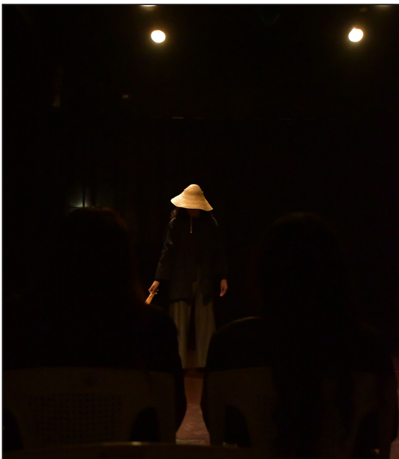
Imagen 2. Elementos de vestuario y utilería, Foro de Corpo- Espacio Danza, Xalapa, Veracruz, México. 2022.